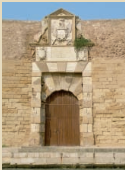
Brindisi, Castello Alfonsino, ingresso di Sant'Andrea

I veneziani, cui lo scalo commerciale brindisino faceva particolarmente gola, nel 1528 inviarono una flotta di 16 galee al comando di Pietro Lando per prendere la città. Costui sapeva, anche memore del fallimento di Marcello, che l'impresa