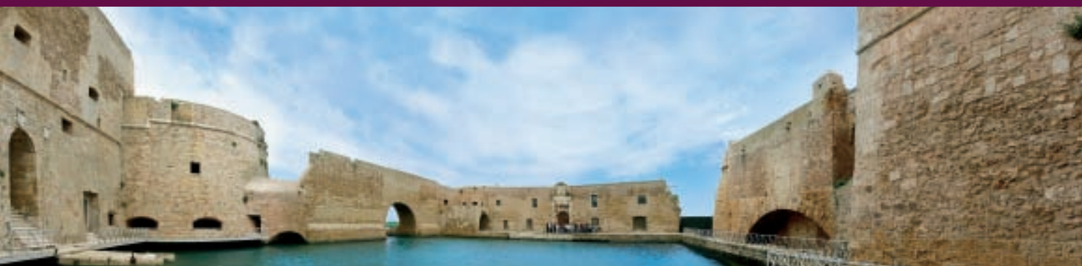
Brindisi, Castello Alfonsino, interno