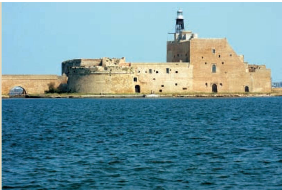
Brindisi, Castello Alfonsino