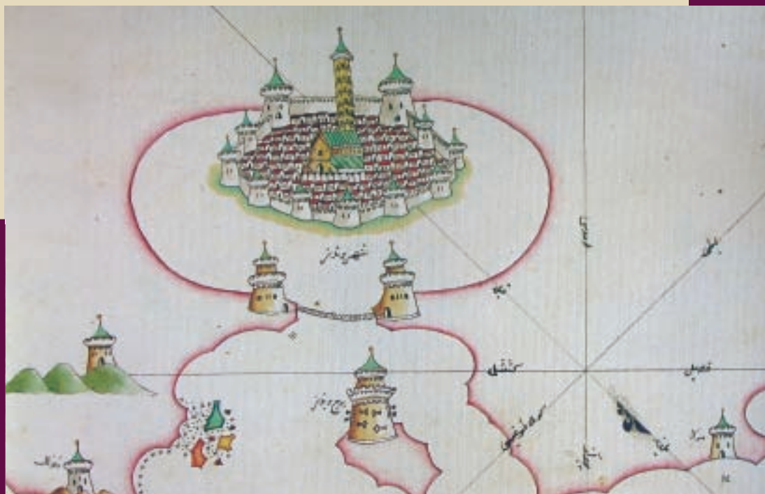
Mappa della città di Brindisi, inizi del '500 (da Piri Reis)